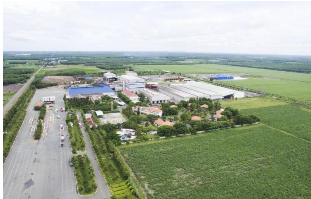
Nhà máy TTCS

Forbes Việt Nam đã công bố danh sách 50 thương hiệu dẫn đầu trong các lĩnh vực kinh doanh tại Việt Nam. Với giá trị được xác định khoảng 20,5 triệu USD, SBT đã vinh dự góp mặt trong danh sách với vị trí thứ 40 nếu xếp chung tất cả các lĩnh vực và đứng vị trí thứ 9 trong nhóm ngành Thực phẩm đồ uống. Forbes Việt Nam thực hiện danh sách này theo phương pháp đánh giá, tính toán vai trò đóng góp của thương hiệu vào hiệu quả kinh doanh của doanh nghiệp, độ phủ và mức độ nhận biết cao với người tiêu dùng. Đối với các chỉ tiêu tài chính, Forbes Việt Nam tính toán thu nhập trước thuế và lãi vay, sau đó xác định giá trị đóng góp của tài sản vô hình. Thu nhập thương hiệu mang lại cho doanh nghiệp được xác định từ giá trị đóng góp của tài sản vô hình sau khi đã áp thuế thu nhập doanh nghiệp và phân bổ tùy theo mức độ đóng góp của thương hiệu trong từng ngành. Giá trị thương hiệu chung cuộc được xác định dựa trên chỉ số P/E trung bình ngành trong khu vực.